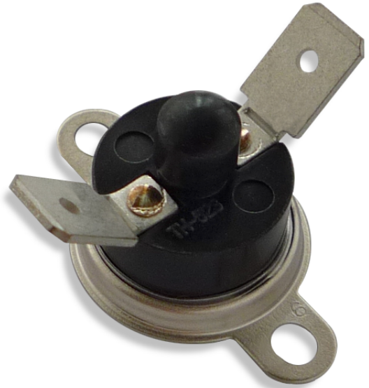
外形寸法図 TH-523Q492RS2 型 (マニュアルリセット型)